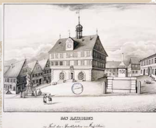
Staffelsteiner Marktplatz um 1840