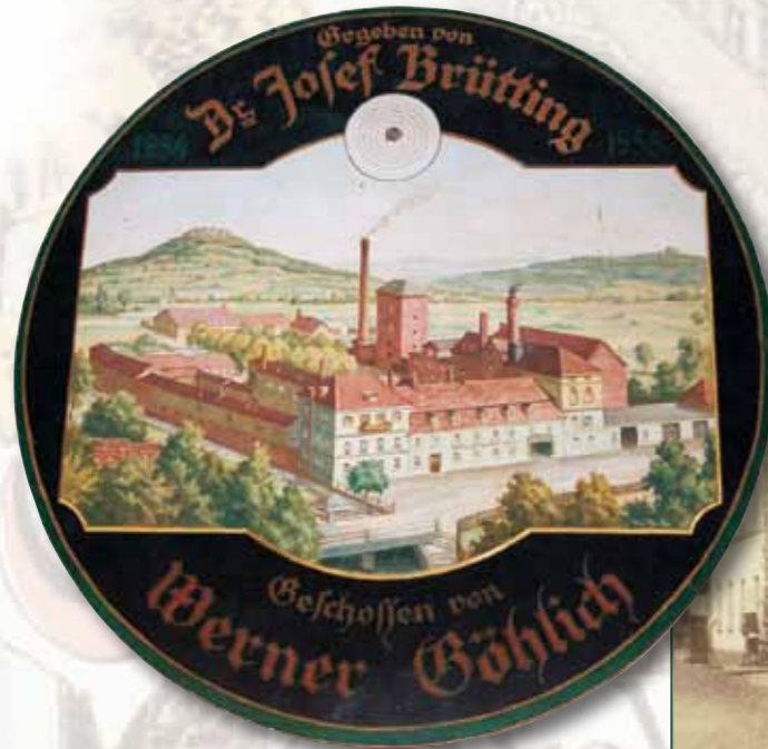
Schützenscheibe um 1950