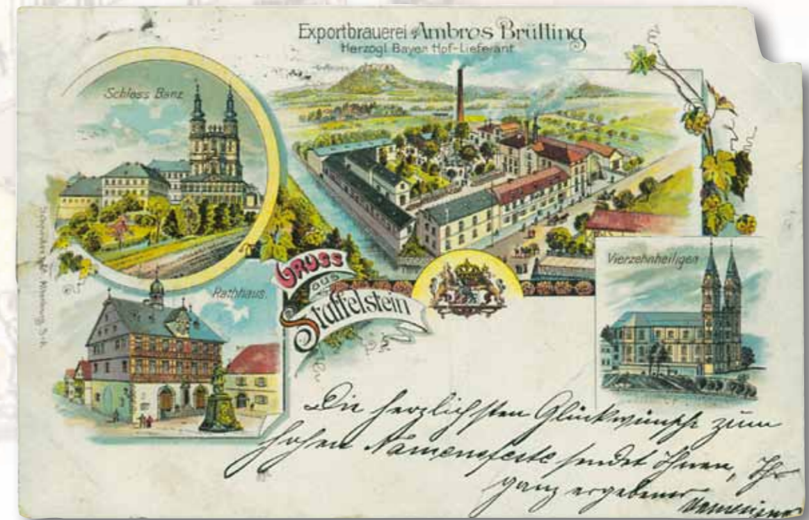
Postkarte der Brauerei Ambros Brütting, 1907