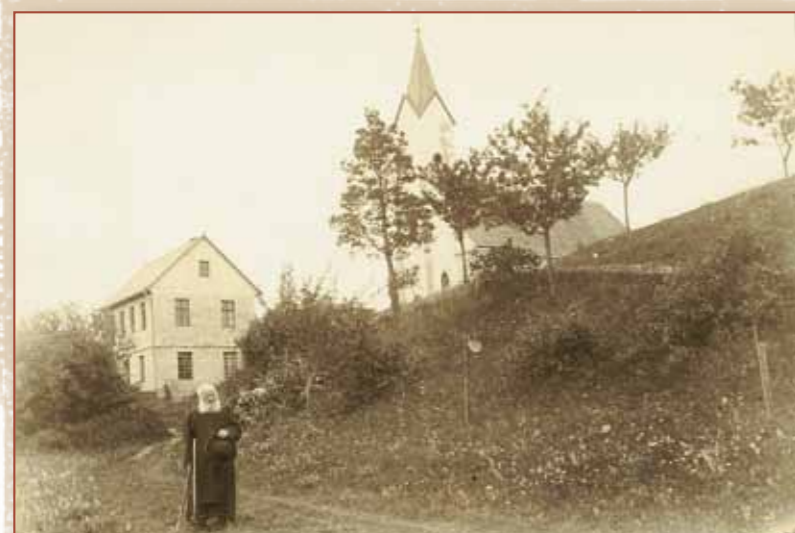
Ivo Hennemann, der letzte Einsiedler auf dem Staffelberg, um 1884