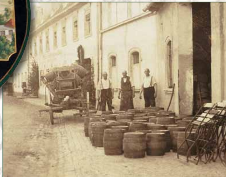
Vor dem Befüllen, Aufnahme um 1910